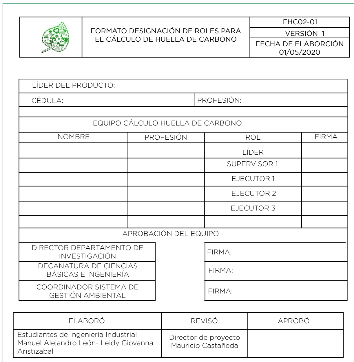
Figura 3. Formato designación de roles FHCO 2 -01