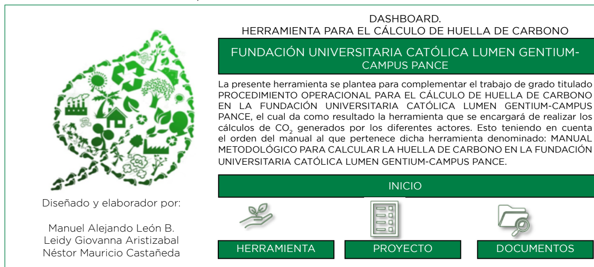
Figura 7. DASHBOARD. Herramienta para el cálculo de huella de carbono