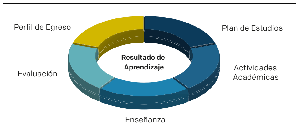
Figura 5. Elementos curriculares que se relacionan con los resultados de aprendizaje en los que es necesario incluir la investigación como eje fundamental para comprender los distintos sistemas que componen el mundo

En los distintos planes de estudio, es necesario considerar resultados de aprendizaje que permitirán evidenciar los avances y las capacidades que se obtienen como resultado de un proceso formativo que promueva las competencias investigativas en los estudiantes al término de cada seminario o curso. De esta forma, los planes de estudio pueden tener, en su contenido, un tema de evaluación que permita la presentación de trabajos tipo artículo, como sucede específicamente en los campos científicos, en los que el componente experimental ofrece la posibilidad de generar un reporte que siga el formato artículo científico. Este tipo de actividad no solo conlleva el fortalecimiento de las competencias investigativas, sino también de aquellas asociadas a la búsqueda de información bibliográfica, redacción, lectura crítica y capacidad argumentativa, lo cual contribuye sustancialmente a mejorar los procesos de aprendizaje gracias a actividades que permiten la aplicación del conocimiento teórico al análisis de situaciones reales (en contextos experimentales y sociales). Según Royo (2010), estos resultados de aprendizaje son uno de los componentes fundamentales para la educación básica (primaria y bachillerato) o superior para alcanzar propósitos de enseñanza, pues se encuentran en el plan de estudios, la organización de las actividades académicas y su articulación con los contenidos (figura 5).