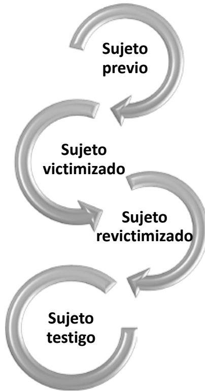
Figura 9. Sujeto social revictimizado.