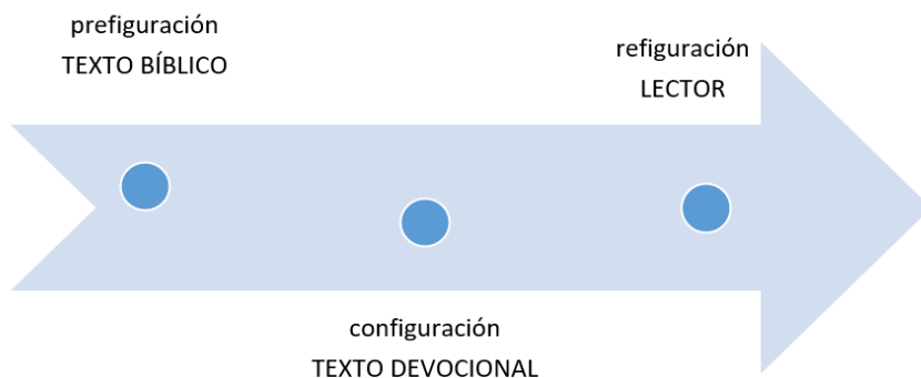
Figura 2. Etapas en el texto devocional

Según lo anterior, en el texto devocional confluyen tres mundos: el del relato bíblico, el del autor del devocional y el del lector. Marguerat y Bourquin (2000) desarrollan la propuesta de Ricoeur acerca de tres etapas en la construcción del relato: mimesis I (antes del relato), mimesis II (el relato) y mimesis III (después del relato). La etapa I es el mundo al que se refiere el relato (prefiguración), la II es el mundo del relato (configuración) y la III el mundo del lector (refiguración). Estas tres etapas se pueden pensar en términos del texto devocional, donde hay una prefiguración en la referencia al texto bíblico y su mundo, una configuración del texto devocional y su mundo y una refiguración en el lector y su mundo.