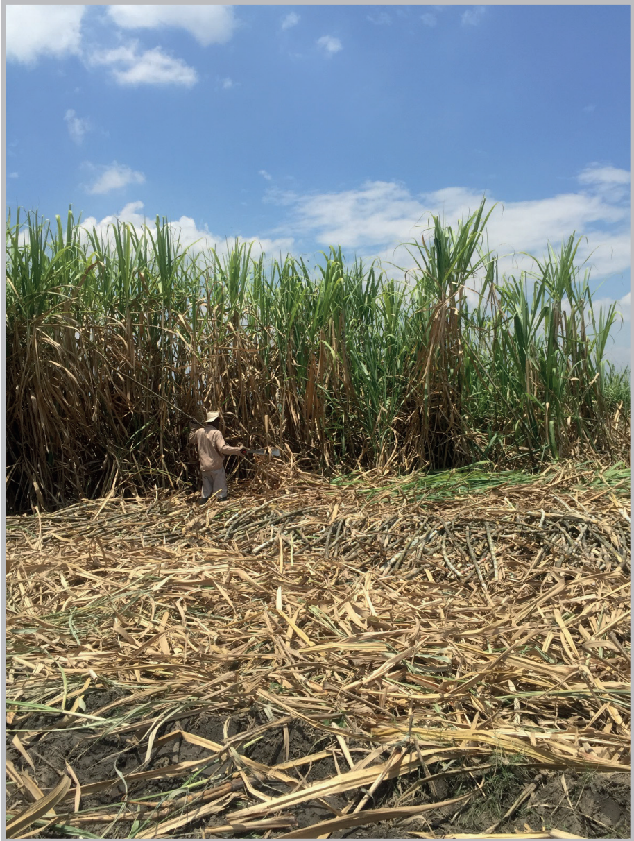
Registro fotográfico por Cristian Bedoya Dorado de cultivos de caña El Carmelo. municipio de Candelaria, Valle del Cauca.