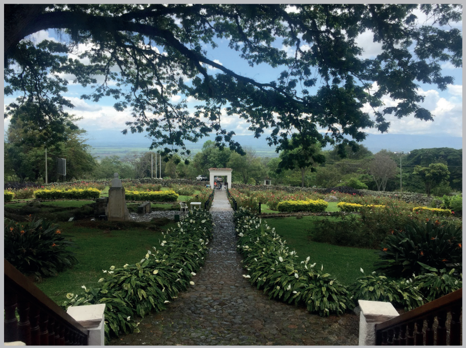
Registro fotográfico por Cristian Bedoya Dorado de la vista panorámica de la Hacienda el Paraíso Municipio el Cerrito, Valle del Cauca